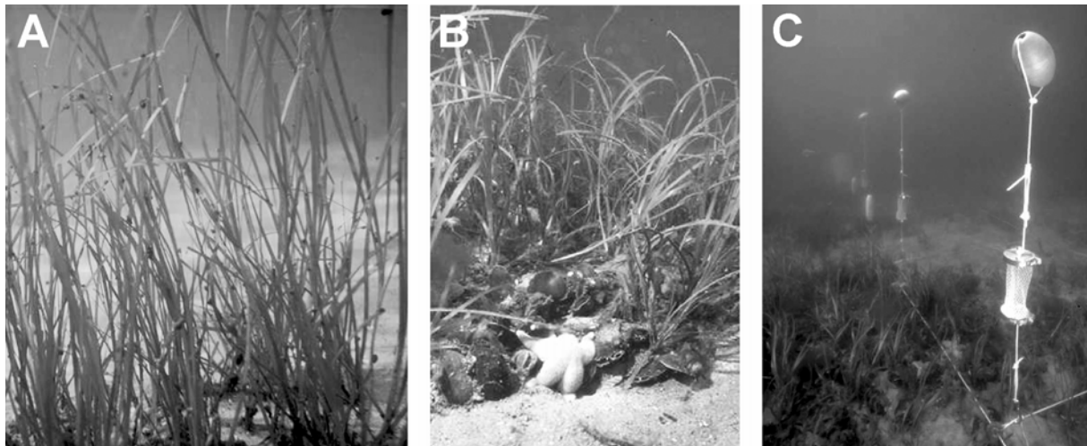
Abb. 1 Das Gemeine Seegras Zostera marina in der Ostsee. A) Seegraswiese. B) Lebensgemeinschaft Seegraswiese. C) Untersuchungsobjekt Seegraswiese.

erreichen, an der mecklenburgischen Küste mit ihren geringeren Salzgehalten findet man das Seegras meistens mit weniger als 1 m langen Blättern (Kobarg 1993; Schories et al. 2005). Zostera marina besitzt nur in den ersten 5-25 mm über dem Boden eine signifikante Steifigkeit, so dass seine bandartigen ledrigen Blätter sich äußerst flexibel auch bei stärkeren Wasserströmungen bewegen können. Durch gasgefüllte Kanäle im Blattgewebe werden die langen Blätter relativ gut aufrecht in der Schwebelage gehalten. Das Sonnenlicht im Wasser kann so für die Photosynthese optimiert genutzt werden. Hohe Wachstumsraten erreicht Zostera marina schon ab einer Salinität von 4 PSU, so dass große Teile der Ostsee und vor allem die deutschen Küstengewässer grundsätzlich einen optimalen Lebensraum darstellen.